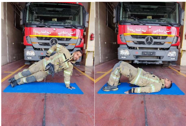
شکل ۳: تمرینات ثبات مرکزی