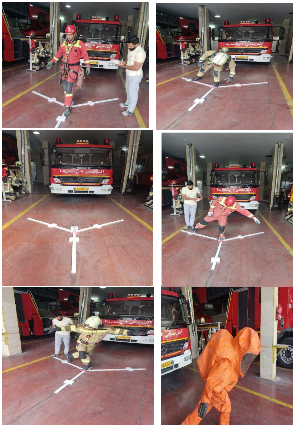
شکل ۲: آزمون تعادل Y

در حالت درازکش به پشت قرار گیرند، سپس فاصله بین خار خاصه قدامی فوقانی تا بخش دیستال قوزک داخلی پا اندازه‌گیری می‌شد. برای هر آزمودنی و هر پا ۲ مرتبه تکرار و میانگین گرفته می‌شد (شکل ۱). سپس میانگین محاسبه