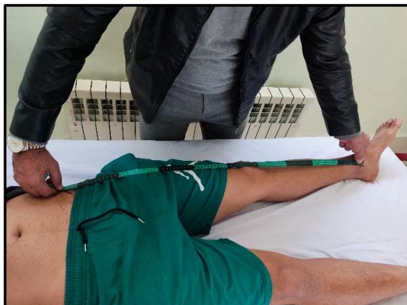
شکل ۱: آزمون طول طبیعی پا

این مدل بمنظور بررسی اثر بین گروهی نوع تمرینات (ثبات مرکزی و عملیاتی-مهارتی)، و اثرات درون گروهی نوع لباس (نجات، حریق و هزمت) و زمان اندازه گیری (پیش آزمون، پس آزمون و ماندگاری) بر تعادل آتش نشانان استفاده شد. پذیره های زیربنایی این مدل شامل نرمال بودن توزیع خطا با استفاده از آزمون شاپیروویلک، همگنی واریانس خطا با استفاده از آزمون لوین و همگنی ماتریس واریانس کوواریانس با استفاده از آزمون باکس بررسی و تایید شد. در مقایسه ی ویژگی های فردی بین دو گروه، با توجه به نرمال بودن توزیع داده ها، از آزمون تی مستقل استفاده شد. تحلیل در سطح خطای پنج درصد و با استفاده از نسخه ۲۶ نرم افزار SPSS انجام شد.